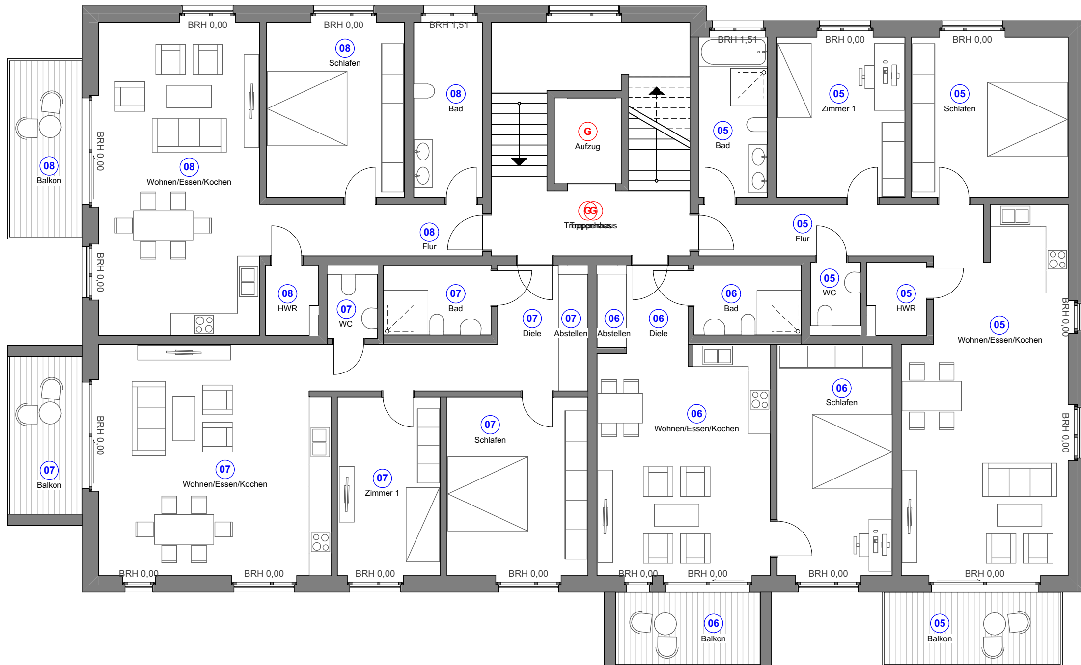
Baufeld V "Auf der Freiheit"