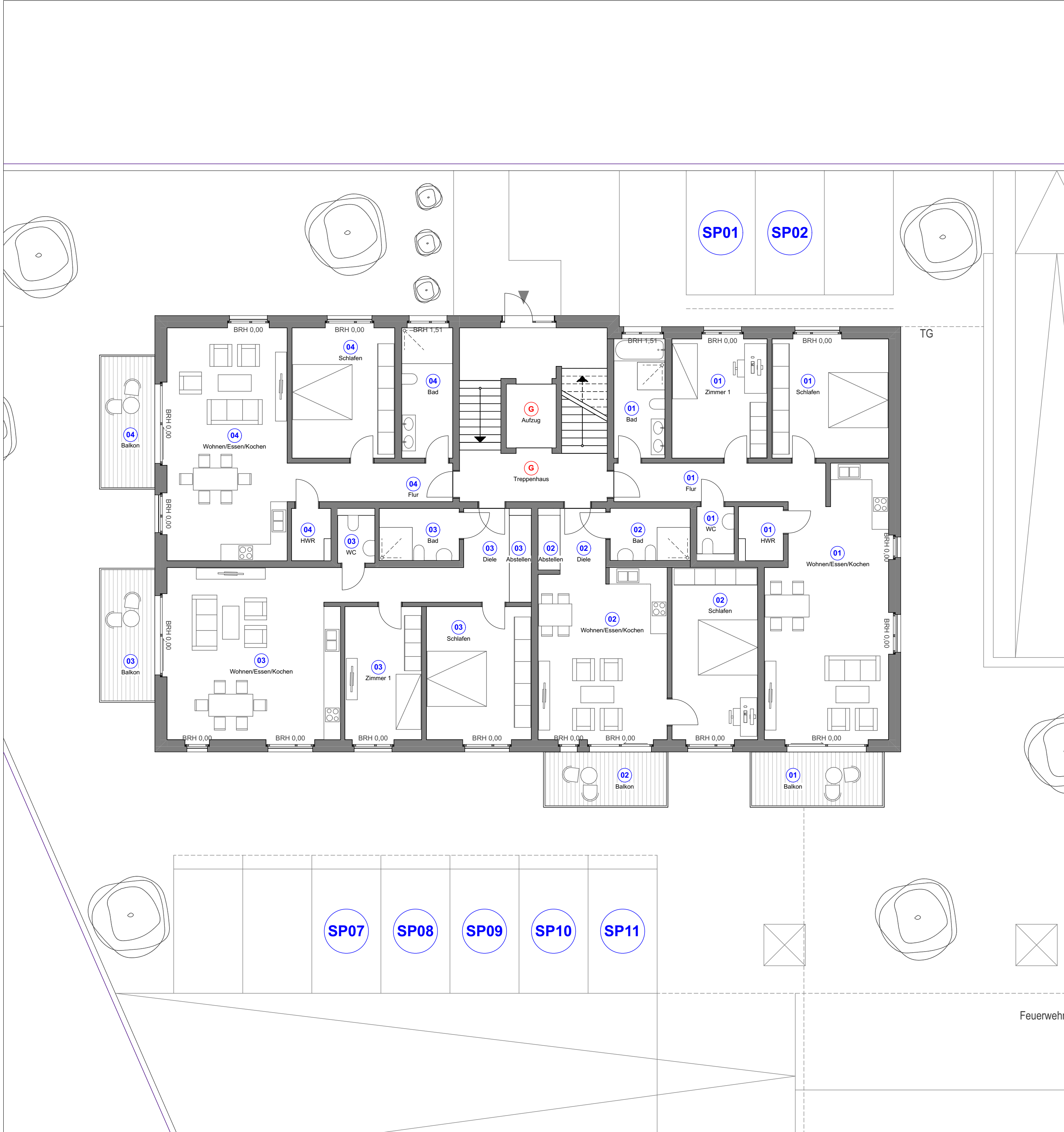
Baufeld V "Auf der Freiheit"